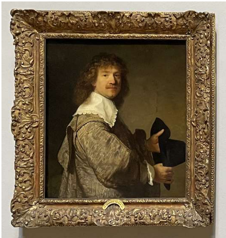
Portrait d'un homme tenant un chapeau noir

Revigorés, nous avons pris la route en direction de Martigny, où nous avons visité la Fondation Gianadda et l'exposition exceptionnelle "De Rembrandt à van Gogh", présentant une quarantaine d'œuvres issues de la Collection Armand Hammer du Hammer Museum de Los Angeles. Martigny constitue l'unique étape européenne de ce voyage transatlantique, et certains tableaux de peintres célèbres y sont même exposés pour la première fois en Europe.