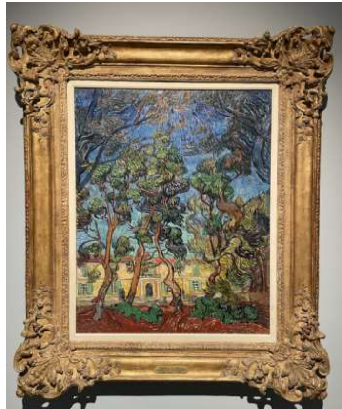
L'hôpital à Saint-Rémy